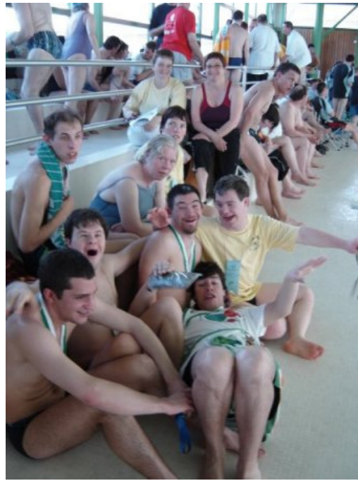
ALOHA au meeting de natation du Mont sur Lausanne

Athlètes: 8 nageuses et nageurs à sélectionner entre les 15 membres du groupe natation d'ALOHA SPORT