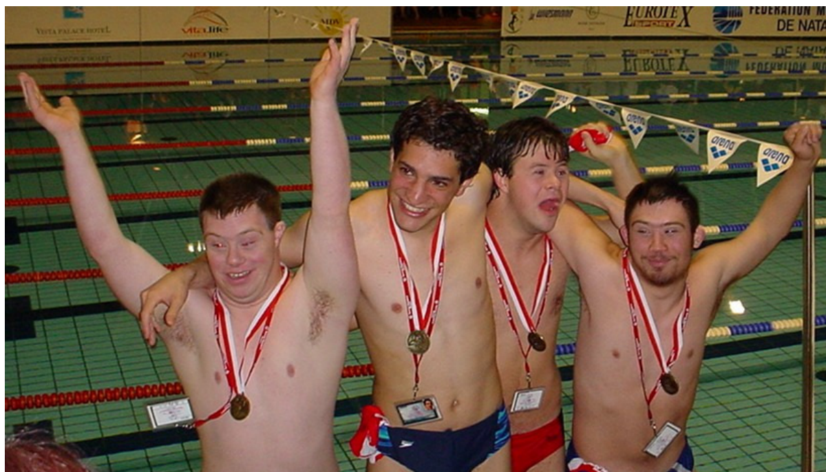
Médaille d'or pour le relais 4 x 25 m d'ALOHA aux European Swimming Games 2002 à Monaco

Association Sportive pour personnes en situation de handicap mental